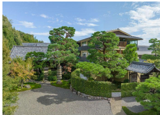
「ホテル外観」イメージ

「翠嵐 ラグジュアリーコレクションホテル 京都」の最新情報はホテル公式ホームページ( www.suihotels.com/suiran-kyoto )にてご覧いただけます。