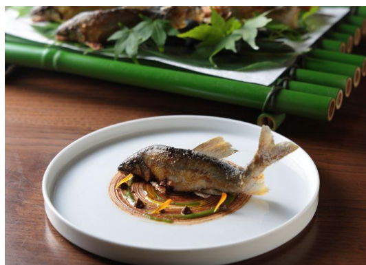
ディナーイメージ