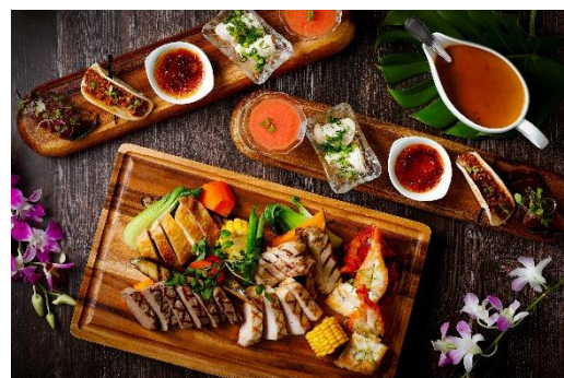
「SHIRAHAMA Poolside Grill Dinner」イメージ