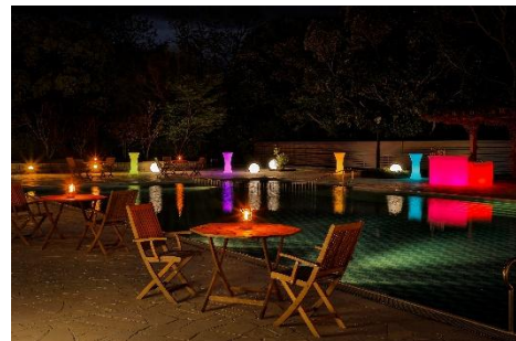
「SHIRAHAMA Poolside Grill Dinner」イメージ