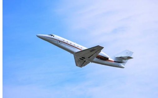
協力：エアロトヨタ株式会社

※往復でのご利用についてもご相談を承ります。詳細はホテルまでお問い合わせください。