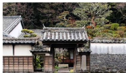
「潜龍酒造」外観イメージ