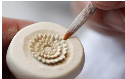
「平戸洗祥団右工門窯」イメージ