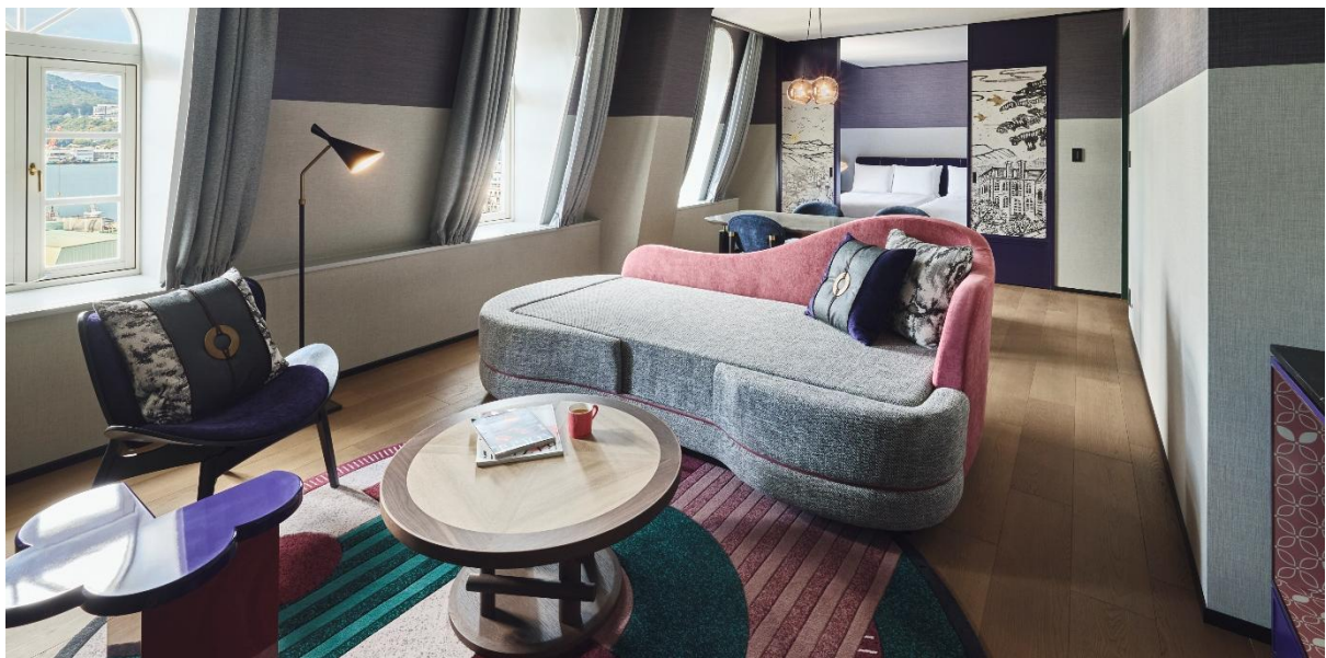
宿泊プラン「THE ART OF HERITAGE」イメージ