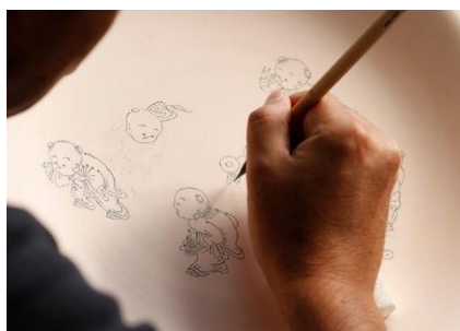
「平戸松山窯」イメージ