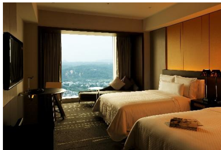
スーベリアルーム イメージ

また、全ての客室には、ウェスティンオリジナルの「ヘブンリーベッド」が設置され、お客様に快適な“雲の上の寝心地”をお約束いたします。