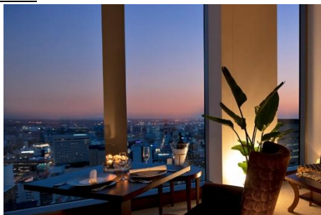
クラブラウンジ イメージ