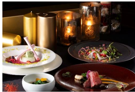
ディナー イメージ

レストラン シンフォニー(26階)では、二方向に広がる美しい眺望とスタイリッシュなインテリア空間が広がり、リラックスした雰囲気の中でお楽しみいただけます。オープンキッチンでは、シェフの調理やキッチンの活気溢れる雰囲気を間近に感じることができ、レストランシェフ自ら東北各地へ出向き、自らの目で確かめた旬の恵みを最大限に引き立てたディナーコースをお召し上がりいただけます。