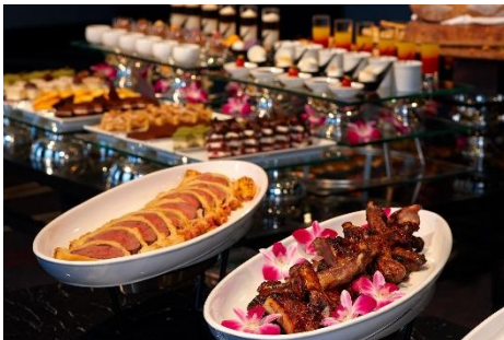
カクテルタイム イメージ