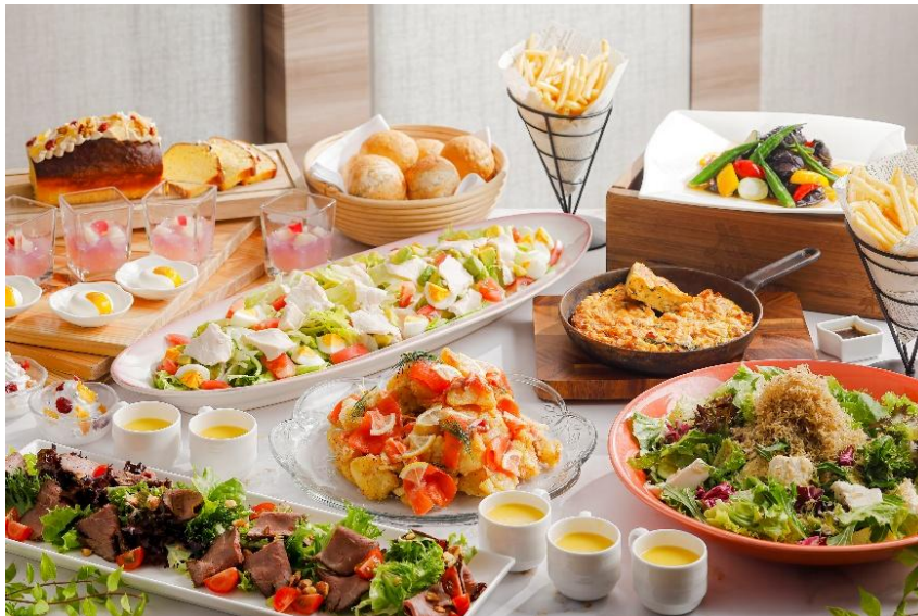
「Pick & Enjoy Lunch」イメージ

琵琶湖マリオットホテル（滋賀県守山市今浜町十軒家2876）総支配人は、2026年6月1日（月）から8月31日（月）までの期間、同ホテル内レストラン「 グリル アンド ダイニング ジー Grill & Dining G」にて、選べるメイン料理とブッフェを組み合わせたランチメニュー「 ピック アンド エンジョイ ランチ Pick & Enjoy Lunch」を発売します。