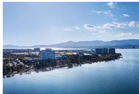
琵琶湖マリオットホテル

URL： https://biwako-marriott.com/index.html