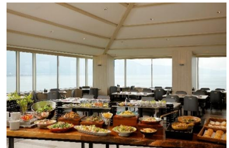
Grill & Dining G イメージ

※上記料金は消費税・サービス料込みの料金です。 ※記載のメニュー内容は変更になる場合がございます。