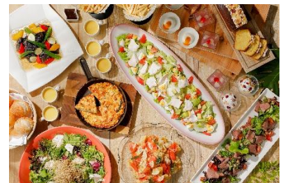
「Pick & Enjoy Lunch」buffet イメージ