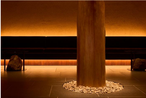
ラフォーレ箱根強羅 湯の棲 綾館 フロント

当ホテルは、スマートチェックインを導入し、利便性と洗練されたデザインとを共存させながら、全室に温泉露天風呂を備え、ドッグフレンドリールームも完備。“五感で浸かり、豊かな時を織りなす”というコンセプト通りに、人も愛犬も箱根の魅力を五感で堪能できるホテルを目指しています。デザインは、最小限の要素で豊かな滞在時間を演出することを重視。地域とともに長い年月を刻んできた、植栽を残しつつ、伐採樹木や箱根火山由来の石材をアップサイクルし、土地の記憶の再現としてインテリアに取り入れています。さらに、ライトモーメント田中氏による“影”にフォーカスした照明設計と、内外が連続する繊細な納まりが空間に深みを与え、心安らぐひとときを提供します。