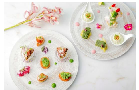
セイボリー イメージ