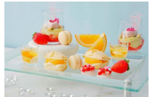
スイーツ イメージ