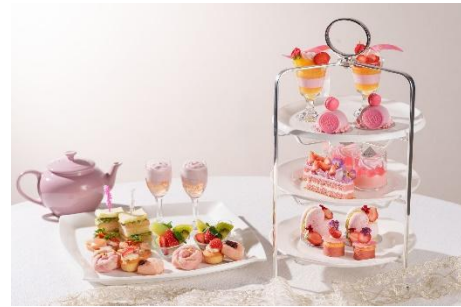
「Pink Berry Afternoon Tea Weekday」イメージ

オリジナルモクテル / JING TEA / Ronnefeldt ティーセレクション / オリジナルコーヒー など 16 種