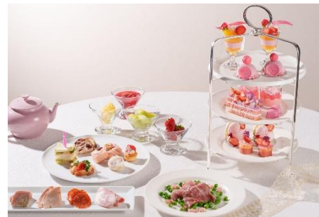
「Pink Berry Afternoon Tea Weekend」イメージ

オリジナルモクテル / JING TEA / Ronnefeldt ティーセレクション / コーヒー など 19 種