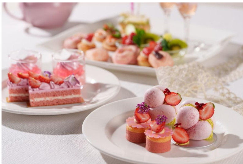
『Pink Berry Afternoon Tea』イメージ