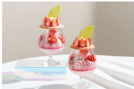
「シーズナルパフェ ～桜風～」イメージ

季節のフルーツや食材が持つ美味しさを最大限に引き出した、パティシエのイマジネーションが光るシーズナルパフェ。宮城県山元町産のブランドいちご“究極のいちご”を存分にお楽しみいただけます。また、お花見気分も味わっていただけるよう、桜風味のアイスクリームや白あんも使用。和と洋のスイーツを重ねたパフェをぜひお召し上がりください。