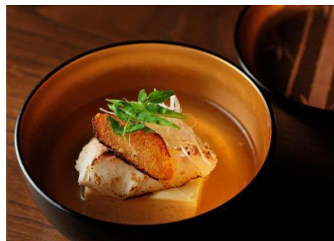
1,2月ディナーコースより一品

提供場所： レストラン「京 翠嵐」 提供時間： ランチ 11:30～14:30、ディナー 17:30～21:00 ディナー： 1名様 10,000円(税金・サービス料込) ランチ： 1名様 5,000円(税金・サービス料込) ご予約・お問合せ： 075-872-1555(レストラン「京 翠嵐」直通)、または restaurant@suirankyoto.com