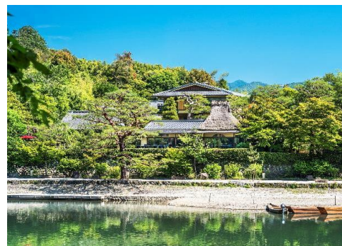
「ホテル外観」イメージ

ホテルは「 けいおうかいらい 継往開来」の開発コンセプトのもとに、古くからの伝統を引き継ぎながらモダンな世界観を融合した、新しいかたちのホテルとして皆様をお迎えいたします。「翠嵐 ラグジュアリーコレクションホテル 京都」の最新情報はホテル公式ホームページ( www.suihotels.com/suiran-kyoto )にてご覧いただけます。