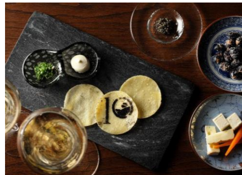
「望月デイルイト」イメージ

「茶寮 八翠」では、毎日夕刻、嵐山の美しい夕景を眺めながらシャンパンを愉しむ「嵐山デイルイト」をご提供しています。さらに、満月の期間には特別な演出を加え、心に残るひとときをお届けします。嵐山の稜線に寄り添うように輝く満月を眺めながら、古の貴族たちに思いを馳せる、心豊かな時間をお過ごしください。