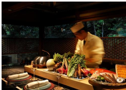
シェフズテーブルイメージ

提供時間： 17:30～21:00 料金： 1名様 30,000円～ ご予約・お問合せ： 075-872-1555(レストラン「京 翠嵐」直通)、または restaurant@suirankyoto.com