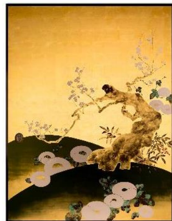
品川亮作「渡月四季花木図」