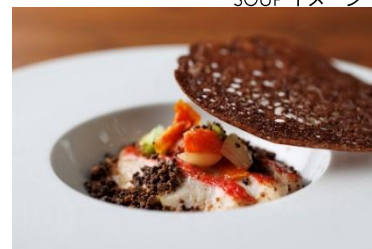
FISH DISH イメージ