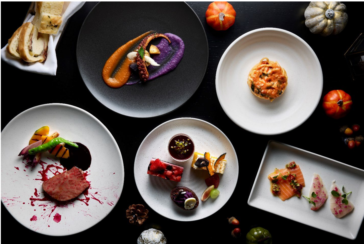
▲「Halloween Dessert Buffet Course」イメージ

アメリカ・ニューヨークに本店を持つモダン・イタリアンのアジア 1 号店 スカルペッタ東京（所在地：東京都港区虎ノ門、支配人：石橋 大輔）は、2024年10月29日（火）～31日（木）の3日間、スカルペッタのシグネチャーメニューとハロウィンデザートブッフェを楽しむ「 ハロウィン デザート ブッフェ コース Halloween Dessert Buffet Course」を期間限定販売いたします。