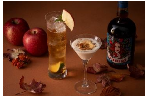
シーズナルカクテル イメージ

芳醇なブランデーの香りと秋らしい栗とりんごのリキュールの味わいが特徴の、口当たり滑らかで、リッチな風味と心地よい甘みが絶妙に調和したクリーム系カクテル。