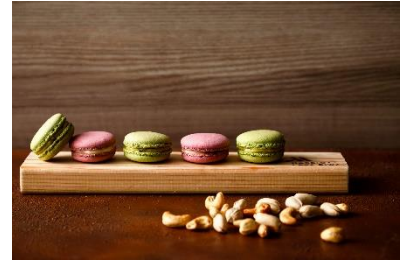
「燻製ナッツマカロン」イメージ