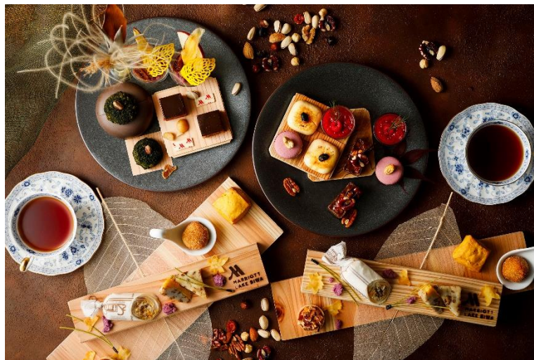
「Going Nuts! ×琵琶湖マリオットホテル」 Autumn Afternoon Tea」イメージ