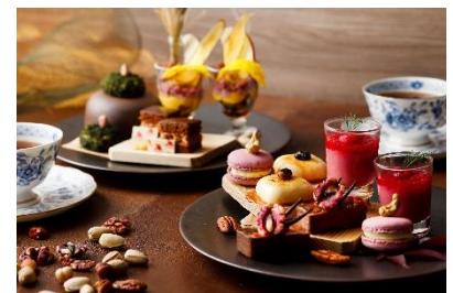
スイーツ イメージ