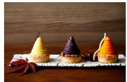
「3種のモンブラン」イメージ

アフタヌーンティーをお召し上がりいただいた方に、季節限定の栗、さつま芋、かぼちゃを味わう3種のモンブランを特別価格でご用意いたします。アドベリーとカシスをアクセントに濃厚な味わいの「栗」、スイートポテトに粒あんのババロアを閉じ込めた和テイストの「さつま芋」、しっとり焼き上げたタルトにリンゴを合わせた「かぼちゃ」の3種が並びます。紅葉に染まる琵琶湖の景色を眺めながら、今秋限定のモンブランを味わう優雅な午後のひとときをお過ごしください。