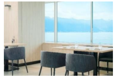
Grill & Dining G イメージ

※アフタヌーンティーとオプションのモンブランは前日17時までの事前予約制となります。