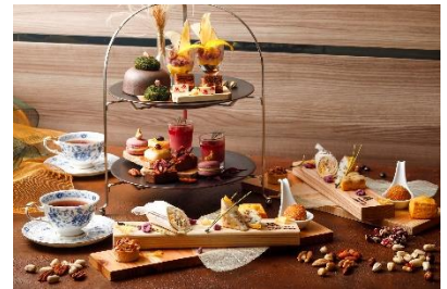
アフタヌーンティー イメージ

秋のおすすめスペシャルティー ロンネフェルトティーセレクション(10種) ※銘柄変更自由 コーヒー