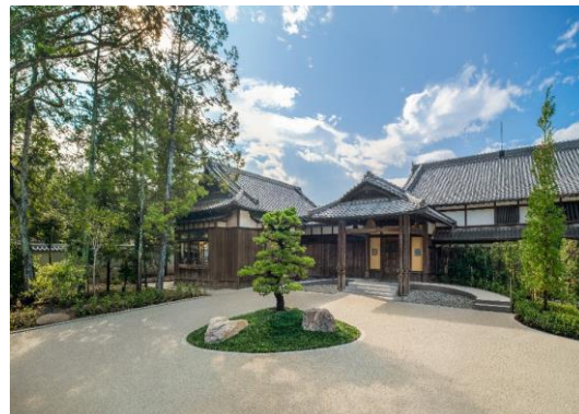
「ホテル外観」イメージ

「紫翠 ラグジュアリーコレクションホテル 奈良」は、森トラストグループが2017年に立ち上げたホテルブランド「翠 SUI」と、マリオット・インターナショナル(Marriott International, Inc 本社:米国)のラグジュアリーホテルブランド「The Luxury Collection®(ラグジュアリーコレクション)」とのダブルブランドホテルとして、2023年夏に奈良県の奈良公園内に誕生いたしました。日本文化発祥の地として世界にも知られる奈良の中でも、特にホテルが立地する吉城園周辺地区は、日本有数の名勝地「奈良公園」の西端に位置し、東大寺や興福寺、春日大社などの世界遺産にも囲まれ、様々な取り組みにより風致が維持されてきた緑豊かなエリアです。古より愛でられてきた「紫幹翠葉」(山々がみずみずしく青々と美しい様子)の風光明媚な情景に由来するホテル名称の通り、奈良が擁する自然や歴史と伝統、そして時の流れの神秘を体感する滞在をお届けいたします。