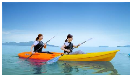
アクティビティ イメージ

琵琶湖マリオットホテルでは夏のアクティビティとして、初心者でも安心してお楽しみいただけるカヤック体験やSUP体験、ヨットセイリングなど、琵琶湖ならではのさまざまなアクティビティをご用意しております。雄大な琵琶湖の絶景とともに夏ならではのアクティビティをご家族でお楽しみください。その他アクティビティを含んだ内容やご予約方法について、詳しくは公式WEBサイトをご覧ください。