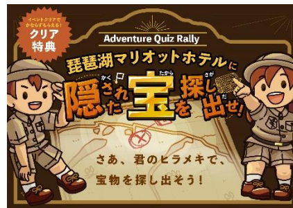
イベント イメージ