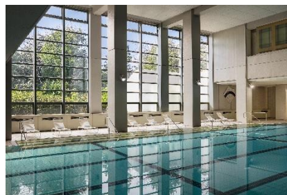
屋内プール イメージ