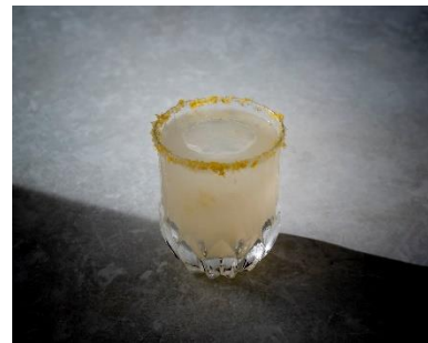
ソルティドッグイメージ

グレープフルーツの風味を活かしたウォッカベースのカクテル。レストランで通常廃棄しているグレープフルーツの皮を乾燥させ、パウダー状にしたピールを塩と混ぜてグラスのふちにつけることで、グレープフルーツの華やかな香りがより広がります。