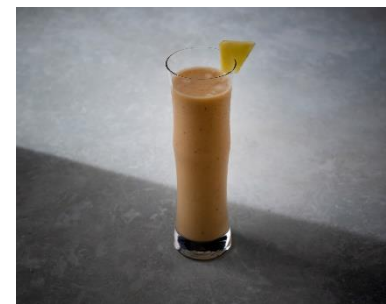
ミックスジュースイメージ

甘みの強いバナナをベースに、パイナップルなどのフルーツと合わせたお子様も大人もお楽しみいただけるフレッシュジュース。シュガースポットが多いため、朝食buffetで提供できないバナナを使用しています。