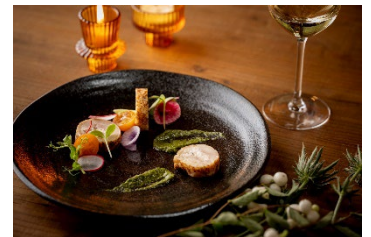
ディナーコース 前菜イメージ