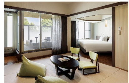
温泉露天風呂付 プレミアルーム