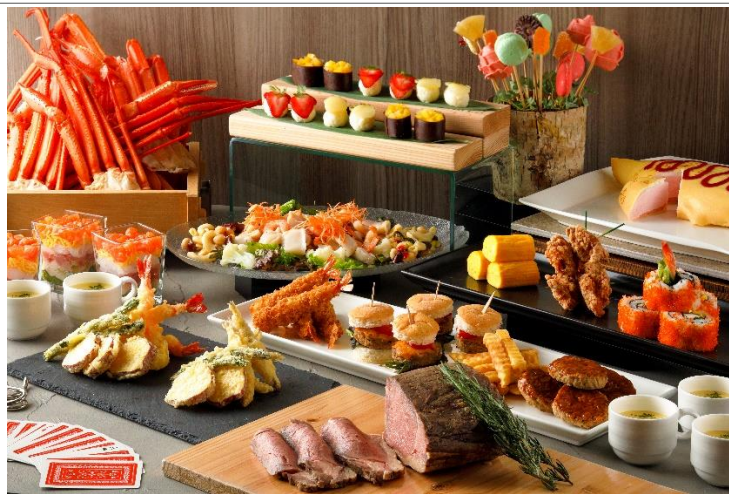
Special Family Buffet イメージ