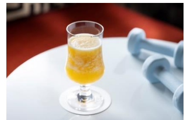
オリジナルドリンクイメージ

フルーツをベースにしたスムージーを運動後にご用意いたします。Dining & Bar LAVAROCK または、お部屋にてお楽しみいただけます。