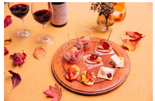
カナッペイメージ