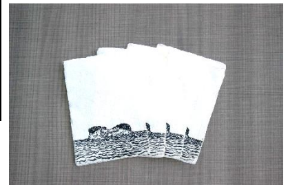
山路紙ポストカード イメージ