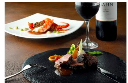
洋食コース イメージ

10月に漁が解禁される、ふっくらとした活伊勢海老をじゃばらの酸味とともにお楽しみいただく魚料理など全7品。メインは国産牛とフォワグラに県産栗や九度山柿、デザートには和歌山山椒が香る洋梨のキャラメリゼなど和歌山の秋を堪能するプレミアムなディナーです。