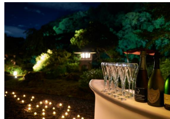
バーカウンターイメージ