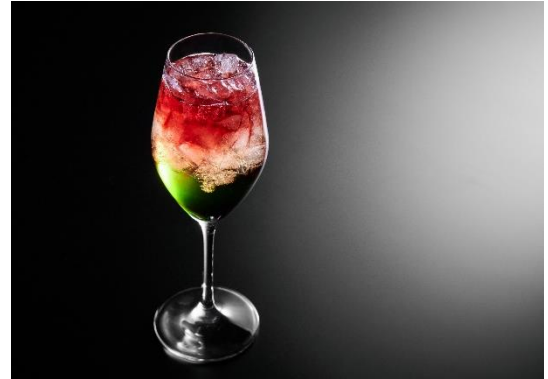
オリジナルカクテル「フラム」イメージ

※ホテルの感染予防対策は https://www.suihotels.com/suiran-kyoto/info/?dp=20200806140759 をご覧ください。