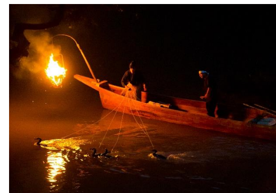
「嵐山鶴飼」イメージ