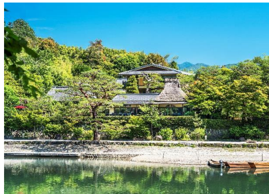
「ホテル外観」イメージ

「翠嵐 ラグジュアリーコレクションホテル 京都」の最新情報は www.suihotels.com/suiran-kyoto にてご覧いただけます。