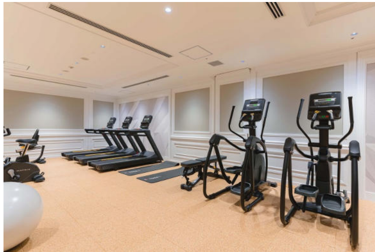
フィットネスルーム イメージ

東京マリオットホテル 身体を動かし、整える フィットネス アンド リラクゼーション 宿泊プラン「 Fitness & Relaxationプラン 」を発売 フィットネスルームオープン記念 期間：2022年1月11日(火)～12月31日(土)