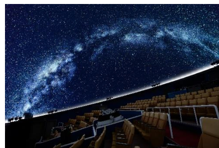
デジタルスタードーム ほたる