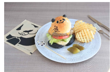
Marriott Panda Burger イメージ