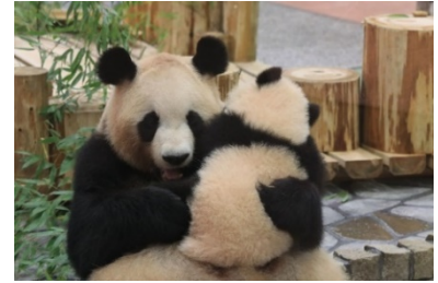
キャンペーン投稿写真 イメージ