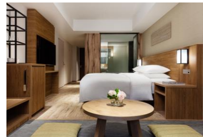
温泉付 プレミアールーム