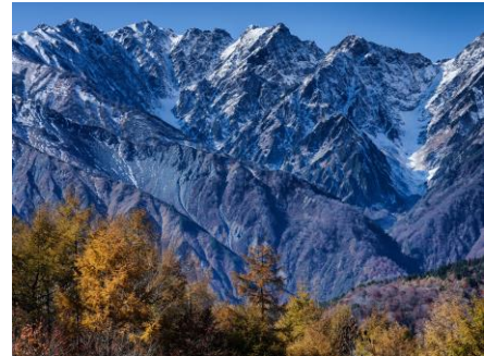
HAKUBA MOUNTAIN HARBOR から望む白馬三山

白馬岩岳山頂にある白馬三山を一望する山頂テラス「HAKUBA MOUNTAIN HARBOR」や、紅葉に染まる白馬岳が眼前に迫る「猿倉」、北アルプスの三段紅葉が見渡せる「鹿島槍スキー場」などを撮影しに巡ります。フォトセミナーでは画角や色彩の撮影技術をはじめとした補正加工技術を直接レクチャーしていただきます。