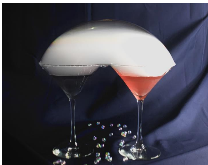
Milky Way Cocktail イメージ