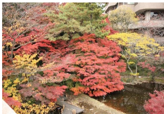
東京マリオットホテルに隣接する御殿山庭園（紅葉見頃:11月頃）