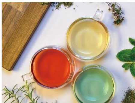
ハーブティー イメージ

さらに同客室には、「最高」の睡眠環境をサイエンスに基づき実現する事を理念に掲げるエアウィーヴ社の最新のベッドマットレスを導入しております。優れた体圧分散と抜群の通気性を兼ね備え、復元性の高いエアファイバー®が寝返りをサポートすることで、寝ている間の筋肉の負担を軽減し、質の高い睡眠へと導きます。心から安心して眠れる環境を整えることで良質な睡眠を提供いたします。最高の空気と睡眠環境で身も心もリフレッシュできる快適な滞在をお楽しみください。