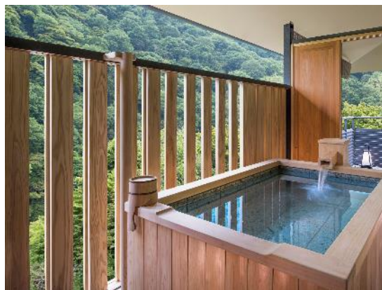
プレジデンシャルコーナースイート温泉露天風呂イメージ

かつては貴族の優雅な遊 あそびどころ 所であった嵐山にて、古都文化を満喫するご滞在をお過ごしください。