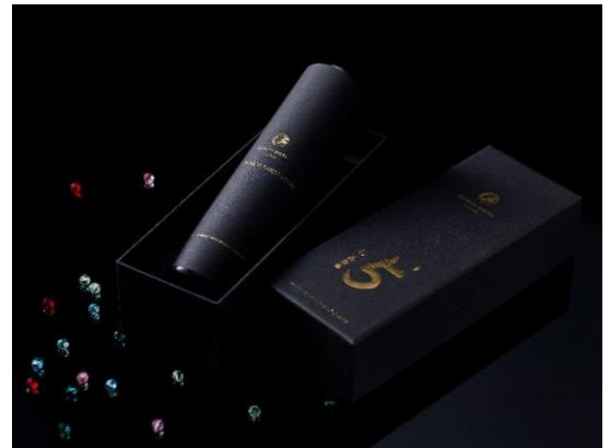
オリジナル万華鏡イメージ