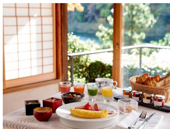
「茶寮 八翠」でのプライベート朝食イメージ