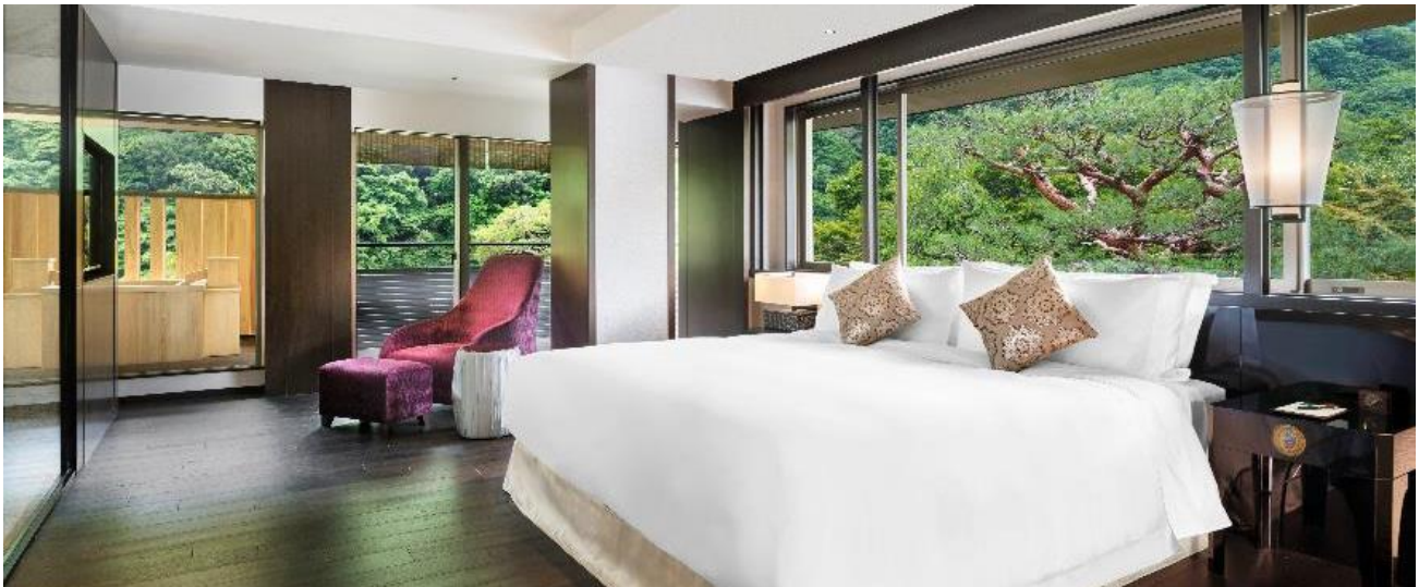
プレジデンシャルコーナースイート「翠嵐」イメージ

「 すいらん 翠嵐 ラグジュアリーコレクションホテル 京都」(所在地：京都市右京区、総支配人：羽鳥寛之)は、おかげ様をもちまして2020年3月に開業5周年を迎えます。ホテルでは5年間の感謝と共に「これからも朝の嵐山の空気に清らかで生粋のおもてなしをお届けしたい」というスタッフ一同の思いを込めて、「凧」をテーマに、様々な記念企画をお届けしてまいります。