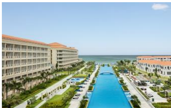
シェラトングランド・ダナンリゾート