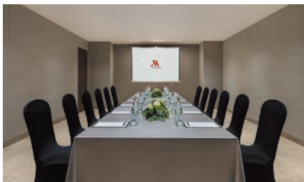
サロン 2 | Salon 2

Three venues flexibly meet the needs of larger gatherings, from corporate retreats and conferences to celebratory family affairs, standing receptions, and other events. At 150 square meters, our largest room accommodates up to 130 guests.