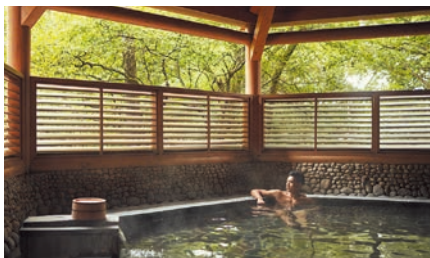
露天風呂 | Open-Air Hot-Spring Bath

Views of Mount Fuji can be enjoyed from our luxurious hot-spring spas. The alkaline thermal waters here are hailed bijin no yu —literally, “beauty baths”—for their natural properties that leave your skin feeling silky and soft as they ease tension and muscle fatigue.