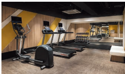
フィットネスセンター | Fitness Center