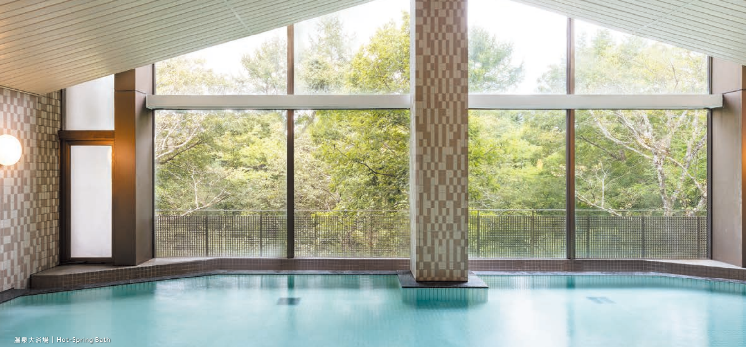
温泉大浴場 | Hot-Spring Bath