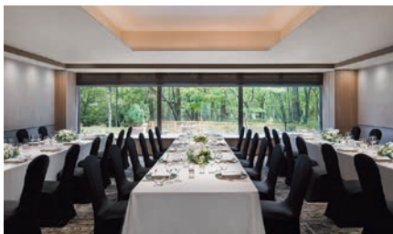
ホール | Hall