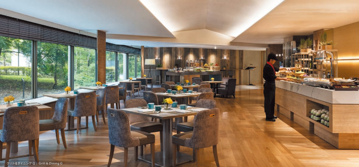
グリル&ダイニング G | Grill & Dining G