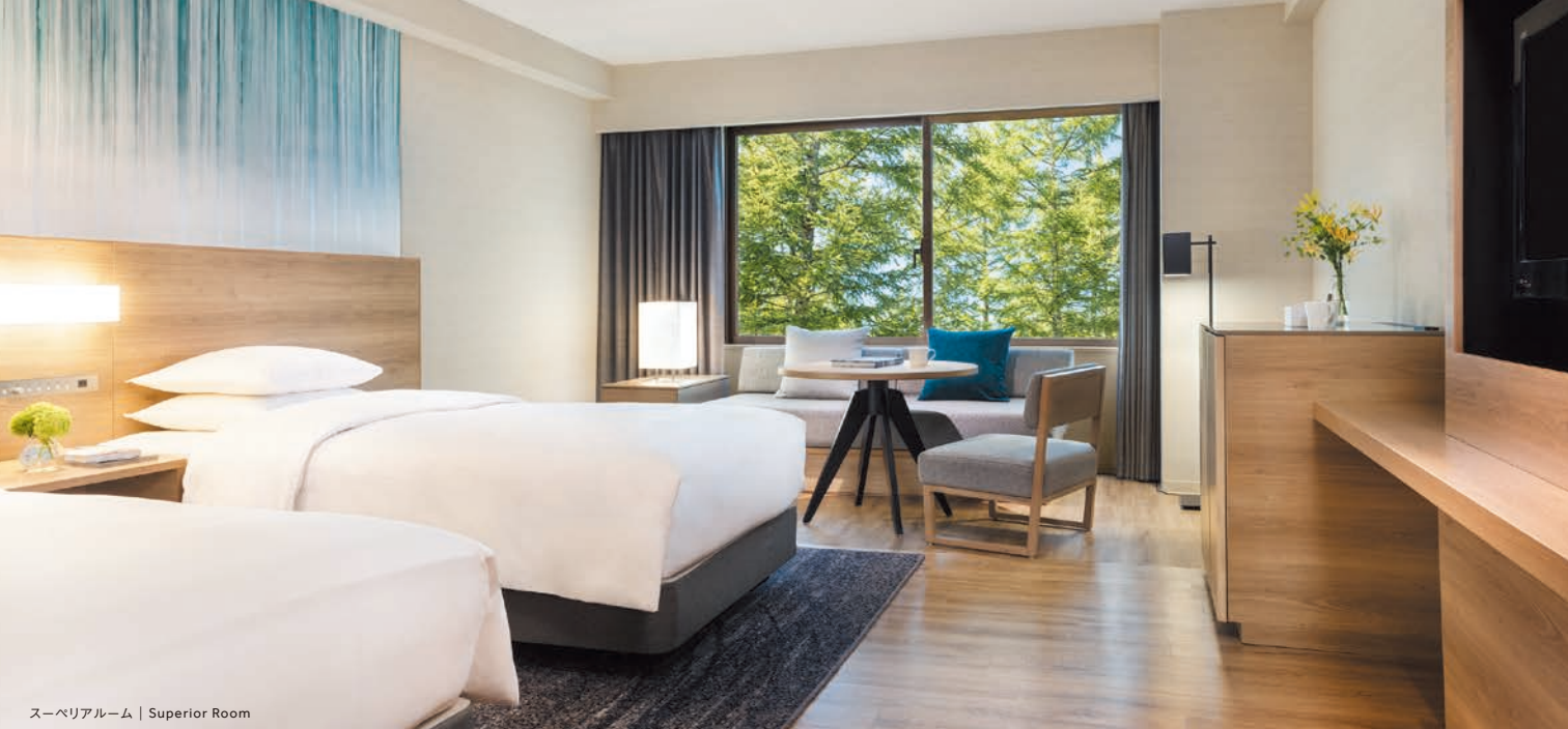
スーベリアルーム | Superior Room