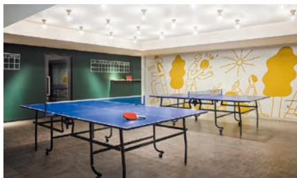
卓球エリア | Ping-Pong Room

Stay active right on-site—Mount Fuji views can also be had from our eight outdoor tennis courts. Or how about a match or two of table tennis in our cheerfully painted Ping-Pong room? In addition, running machines and other workout equipment are available 24 hours daily.