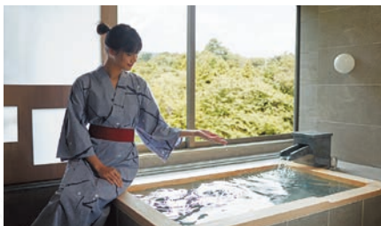
エグゼクティブスイート | Executive Suite