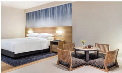
和洋室 | Japanese-Western Room

Designed for comfort, our 105 non-smoking rooms invite relaxation with their imagery of shimmering waters and moonlight providing a backdrop to the alpine views. Standard rooms begin at a spacious 41 square meters and suites feature a hot-spring-fed bath.