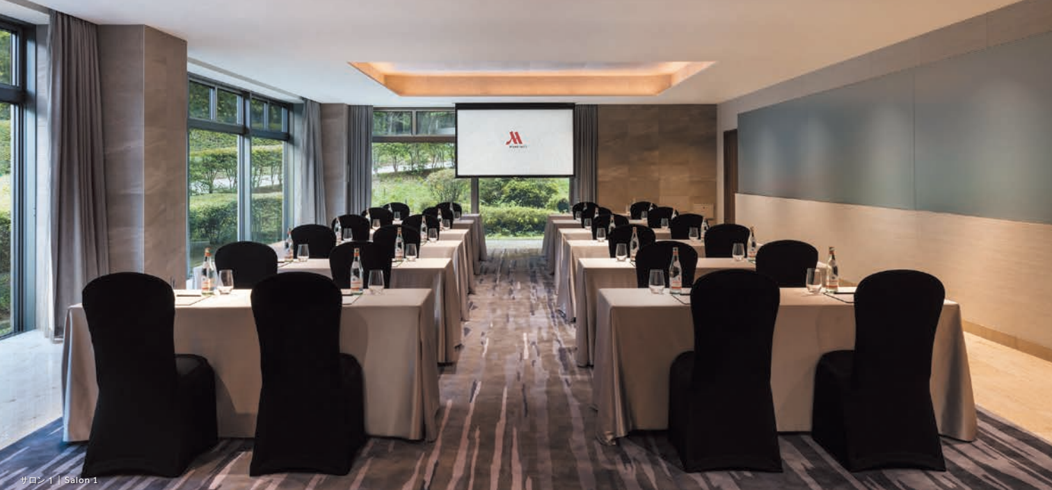
サロン 1 | Salon 1