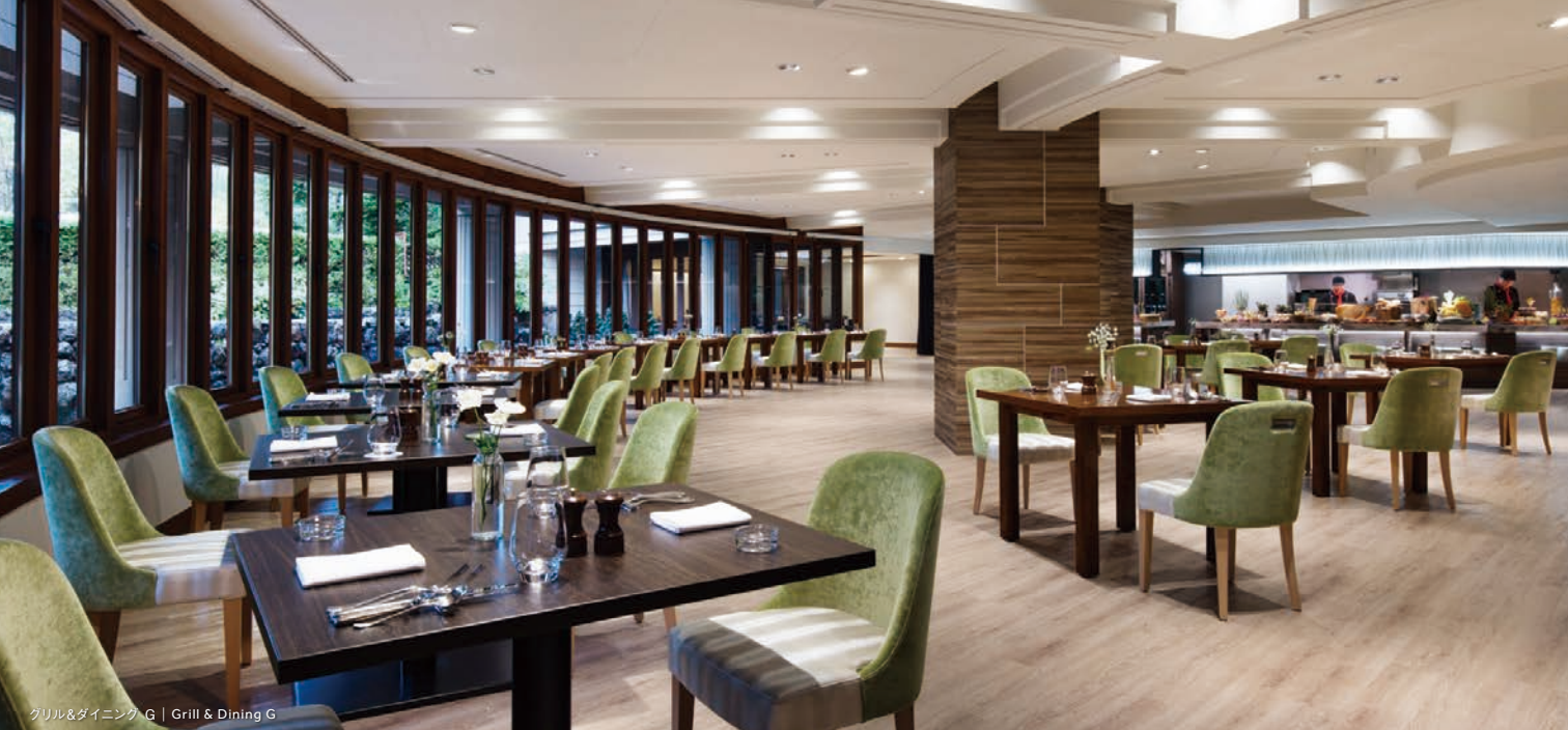
グリル&ダイニング G | Grill & Dining G