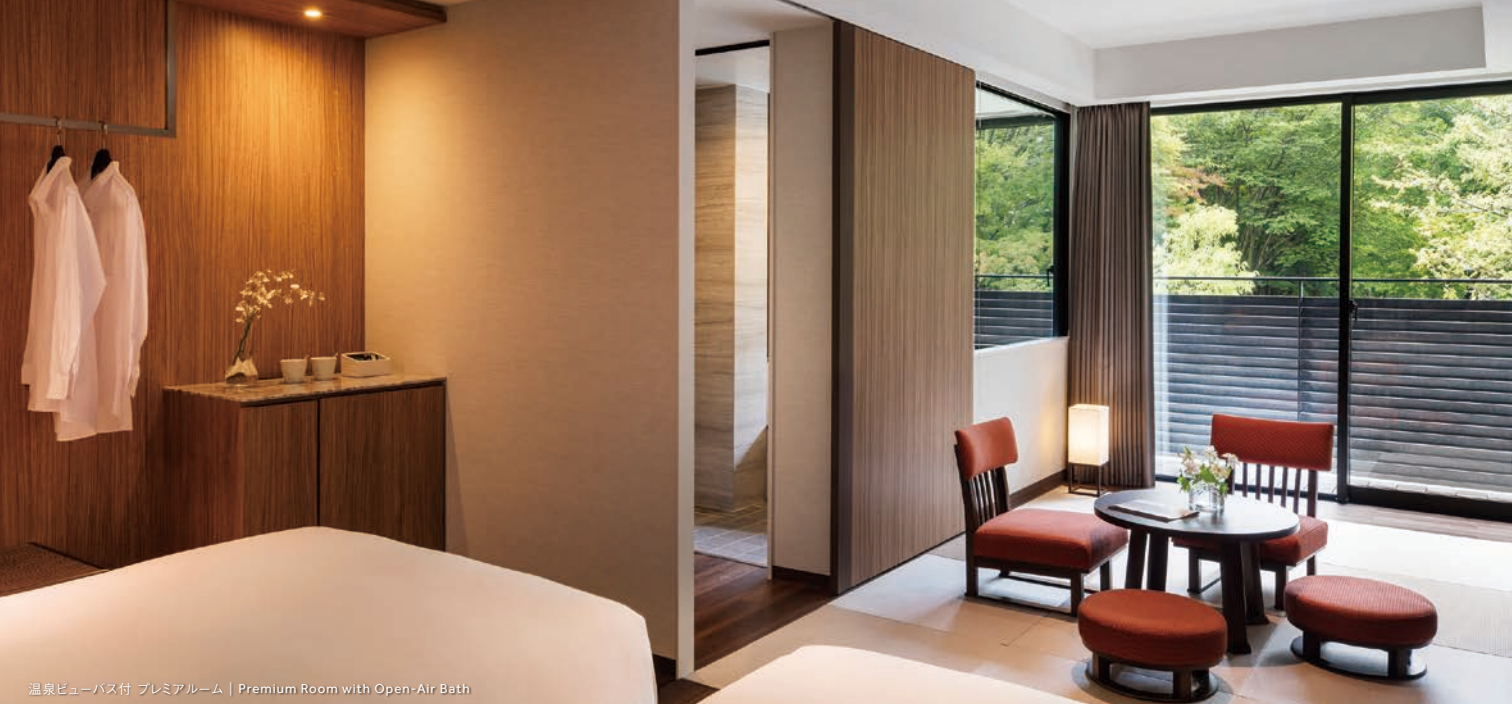
温泉ビューバス付 プレミアルーム | Premium Room with Open-Air Bath