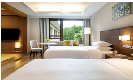
ジュニアスイート | Junior Suite Room