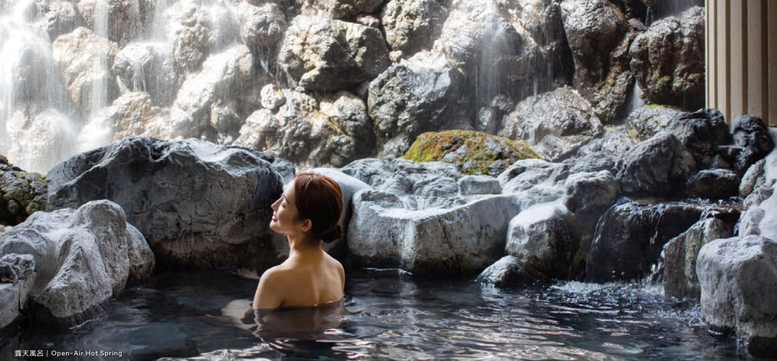
露天風呂 | Open-Air Hot Spring