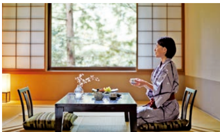
和室 | Japanese Room

The 76 rooms in our Main Wing bespeak the high-end elegance of Karuizawa. Select your preference from among Western rooms overlooking forested grounds, gracefully appointed Japanese rooms, and spacious suites that offer the best of both styles.