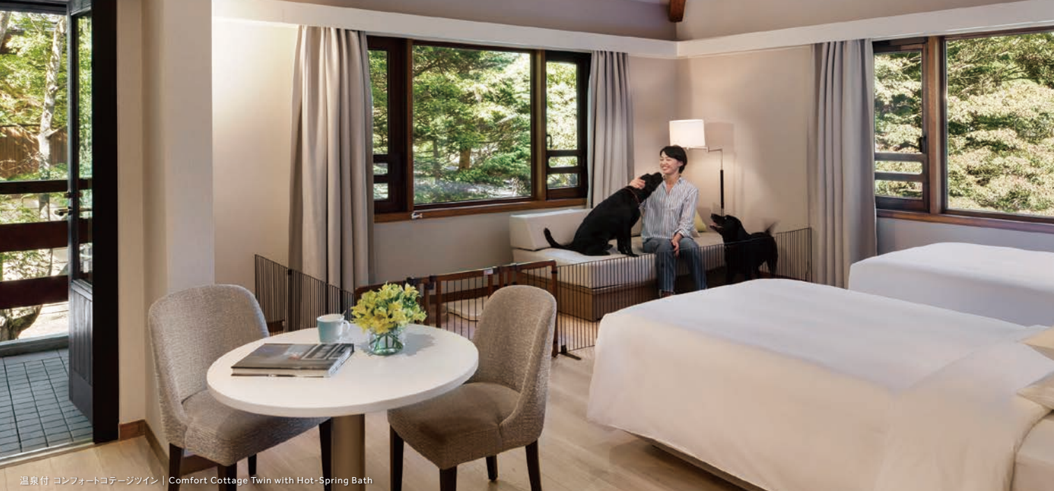
温泉付 コンフォートコテージツイン | Comfort Cottage Twin with Hot-Spring Bath