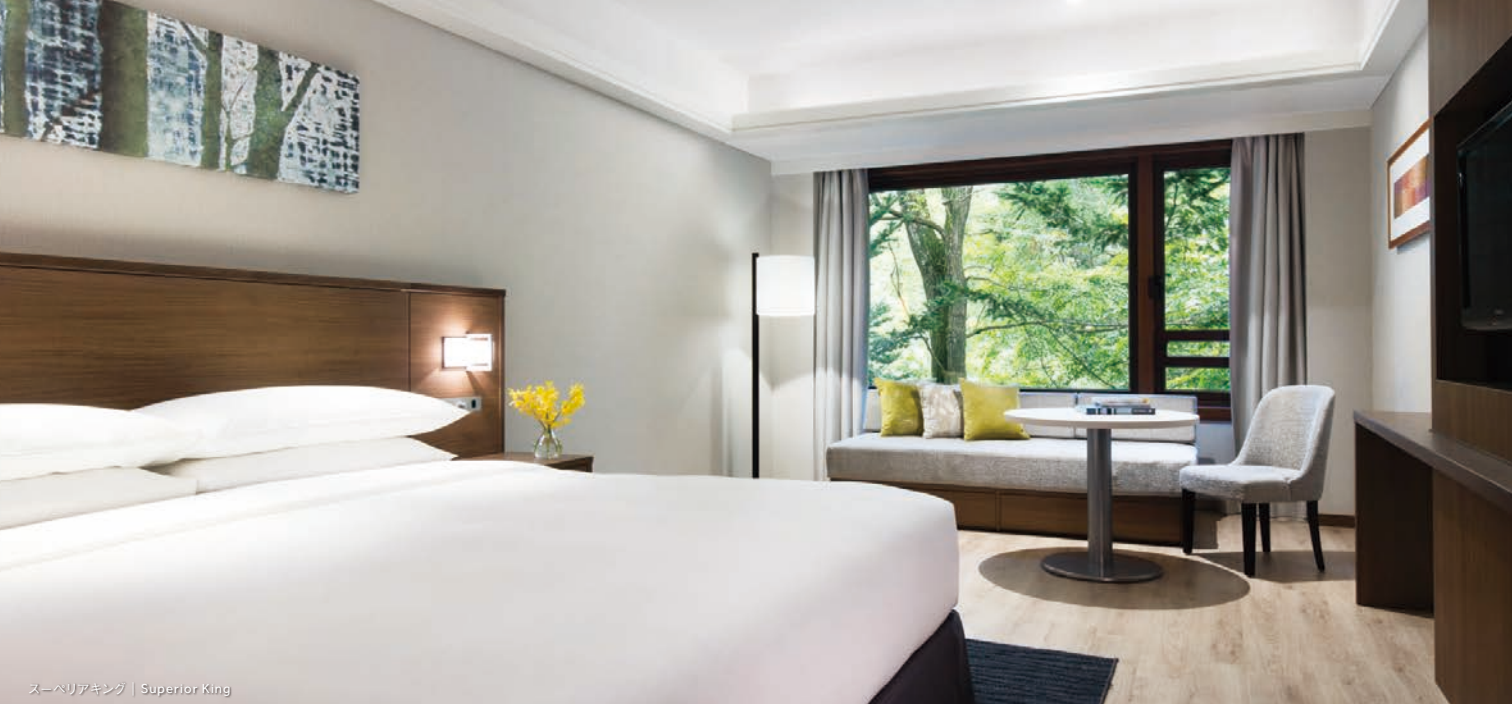
スーペリアキング | Superior King