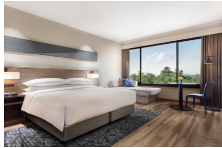
スーペリアルーム（一例）