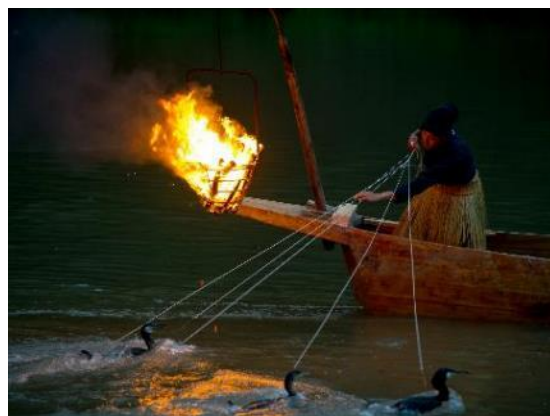
「嵐山鶺鴒」イメージ

現在では、鶺鴒は毎年7月1日より2ヵ月半行われる、嵐山の夏の風物詩として多くの観光客に親しまれています。夕刻、かがり火を焚いた2艘の鶺鴒舟にそれぞれ烏帽子と腰蓑を纏った鶺鴒匠が乗り、鶺鴒と共に上流より登場、鶺鴒が鮎を捕まえるたびに観客から歓声が上がります、悠久の自然とともに夏の宵を堪能します。