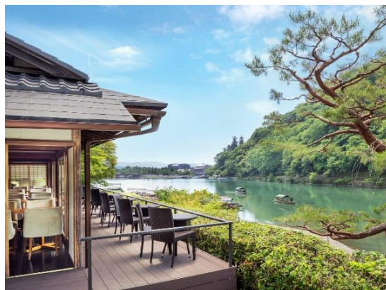
「茶寮 八翠」イメージ