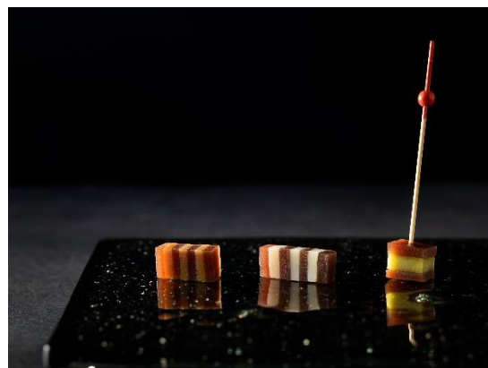
虎屋「小倉羊羹 夜の梅」アレンジメニュー 左からフォアグラ、ホワイトチョコレート、アボカド

開催日： 2018年7月22日(日) 場所： 「茶寮 八翠」 (翠嵐 ラグジュアリーコレクションホテル 京都内) 受付： 13:00～ 日本庭園 セミナー： 13:30～15:00 参加費： 5,000円(税金・サービス料別) 内容： ・ 鶺鴒匠のお話と、「琥珀製 鶺鴒船」のご賞味 ・ 「小倉羊羹 夜の梅」の アレンジメニュー紹介とご試食 ご予約： TEL:075-872-1222(「茶寮 八翠」直通)または、 info@suirankyoto.com までご連絡ください。 ※定員に達し次第受付を締め切らせていただきます。